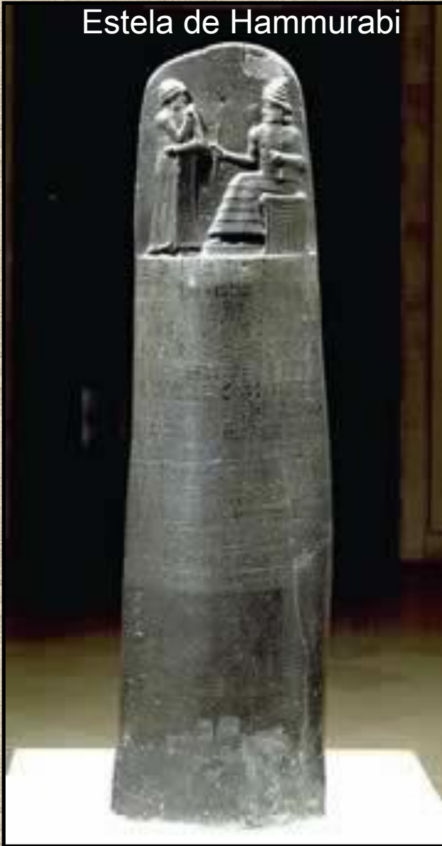
Estela de Hammurabi